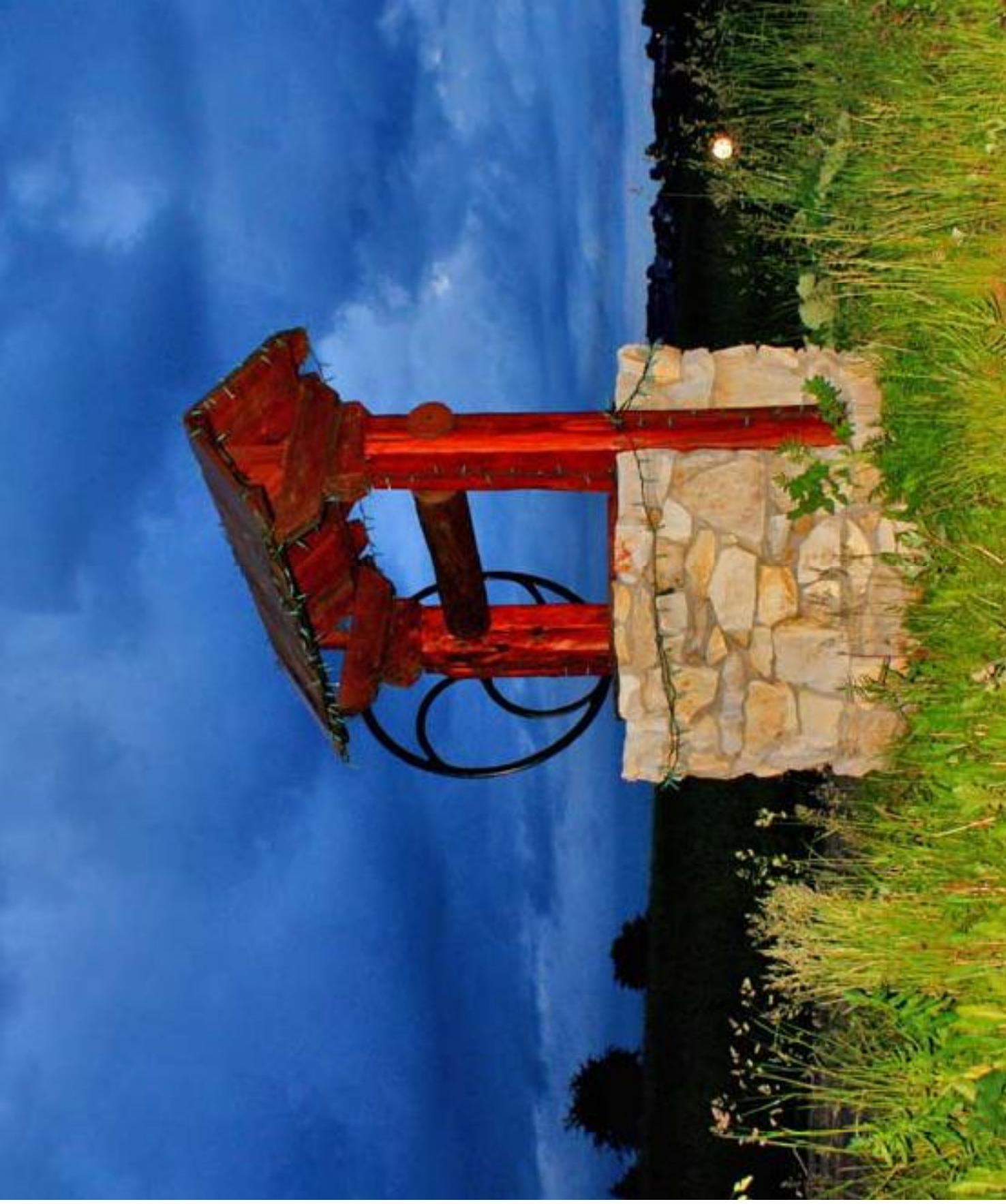
Studnia w Rzeniszowie Well in Rzeniszów