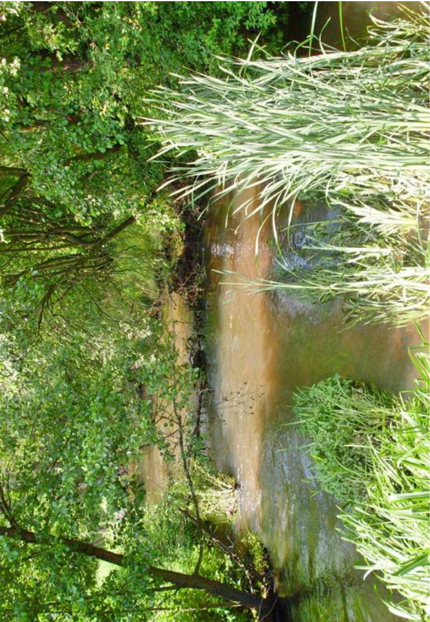
Dzikię koryto Warty - okolice miejscowości Oczko Uncultivated water bed of Warta - nearby Oczko