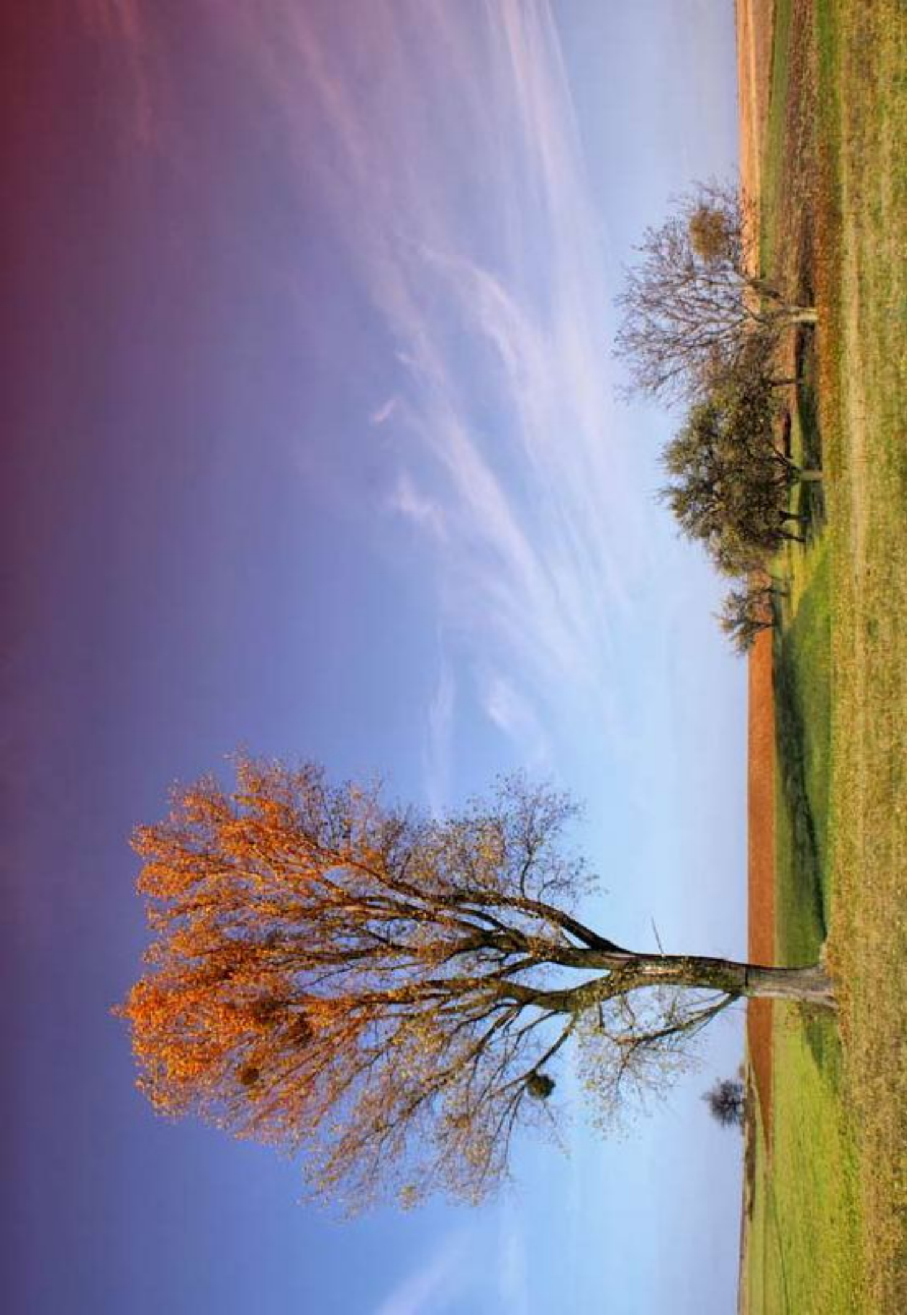
Pola między Cynkowem a Markowicami Fields between Cynków and Markowice