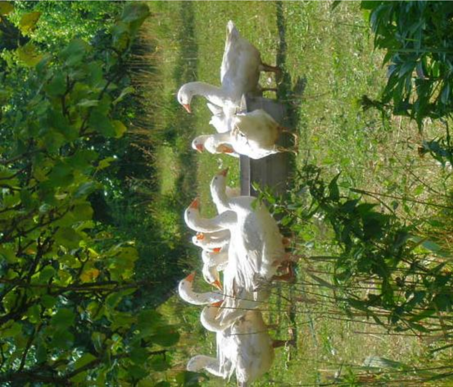
Geese by the watering place