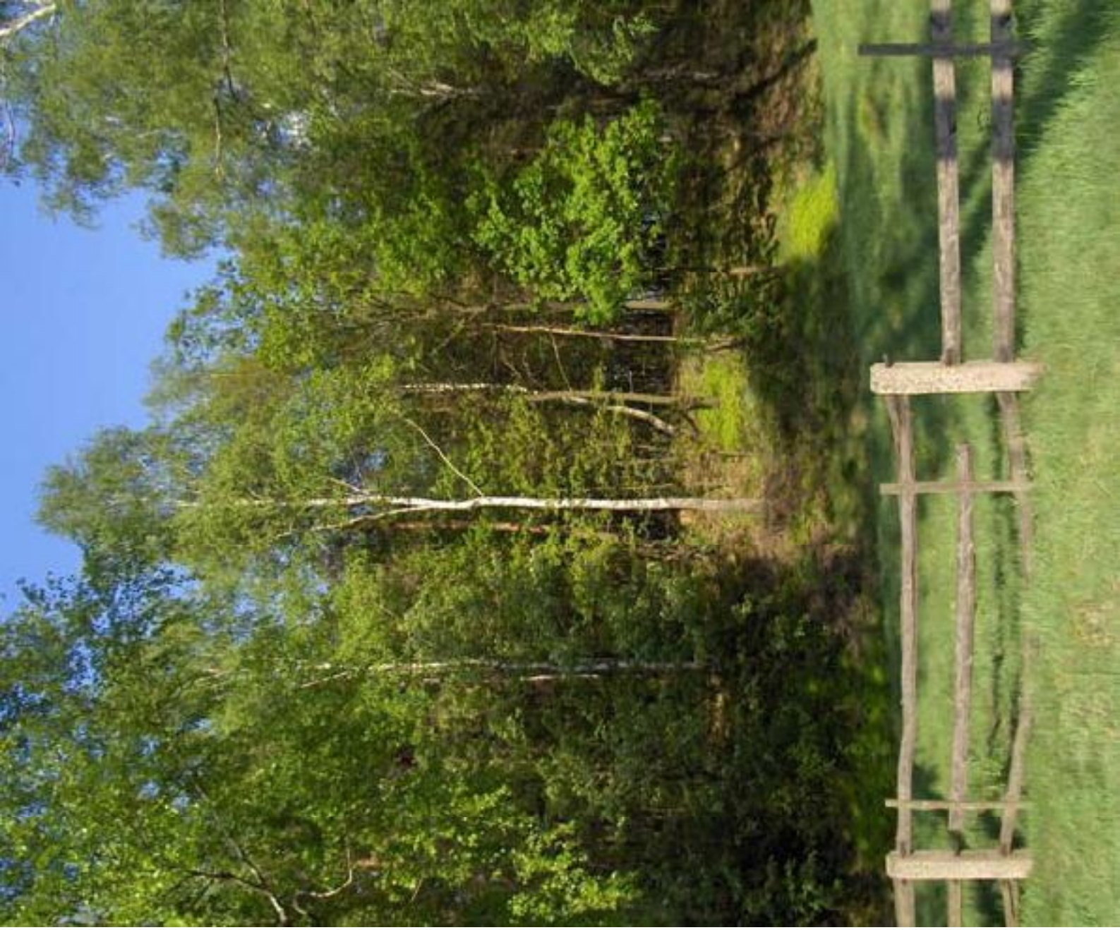
Okolice Cynkowa Around Cynków