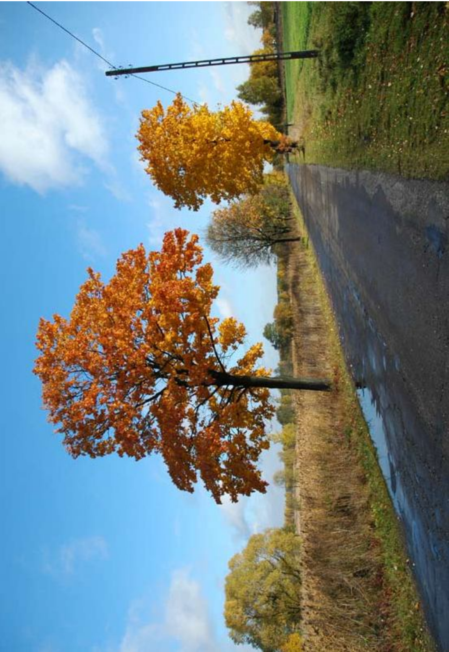
Droga Myszków - Mysłów - Koziegówki Myszków-Mysłów-Koziegówki track