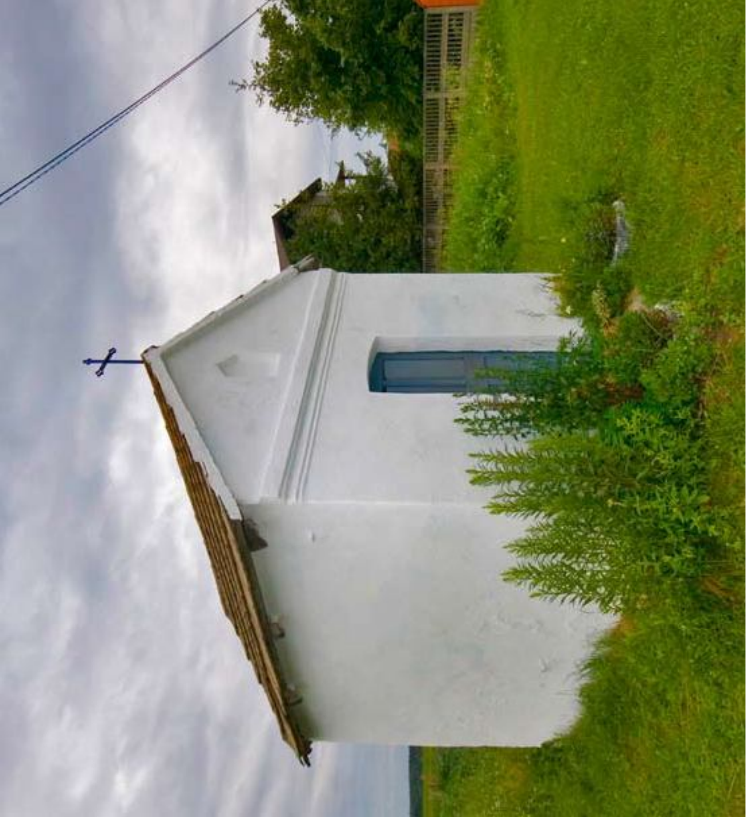
Zabytkowa kapliczka w Koclinie