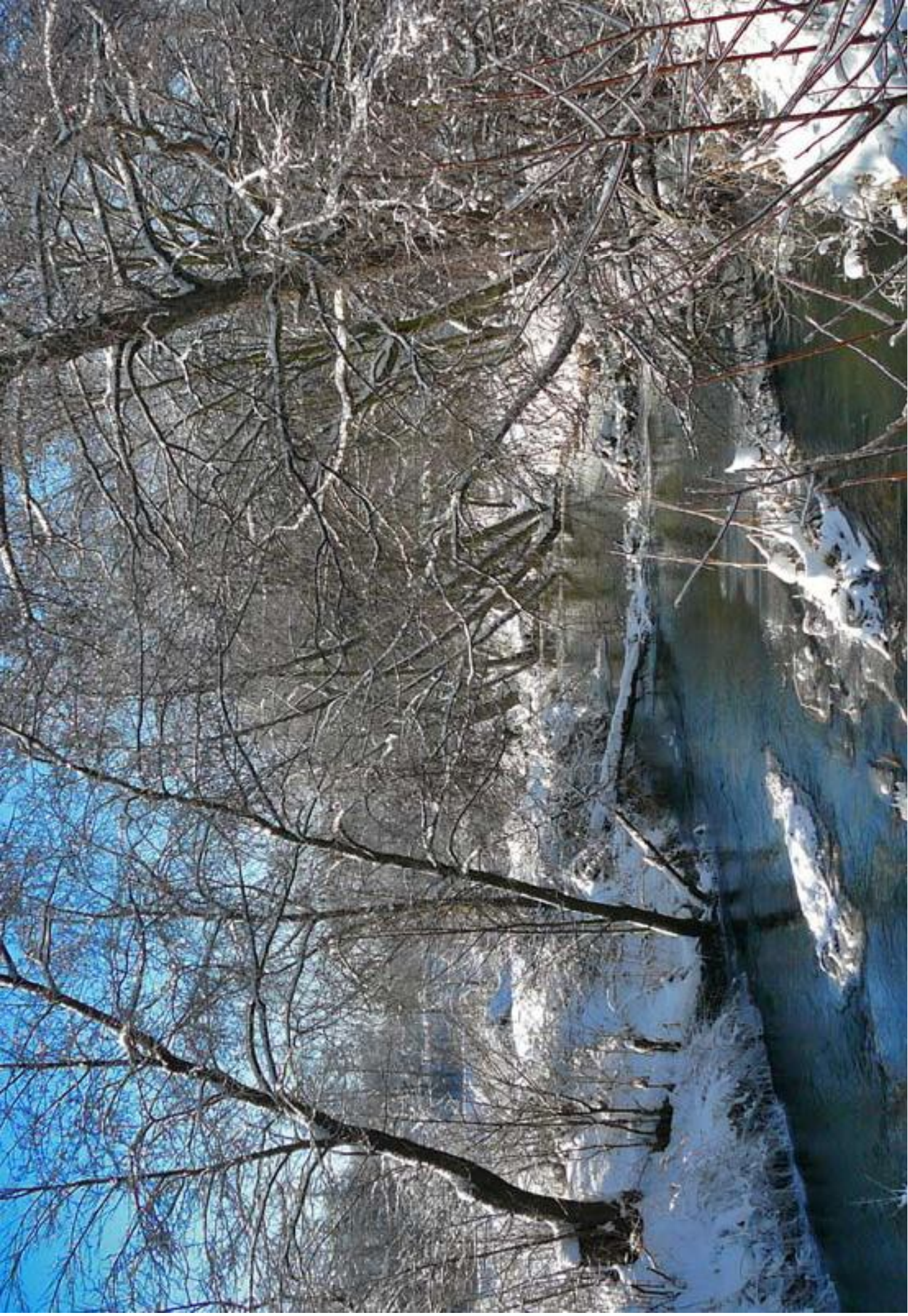
Rzeka Warta Zimq - Nadwarcie Warta river in winter - Nadwarcie