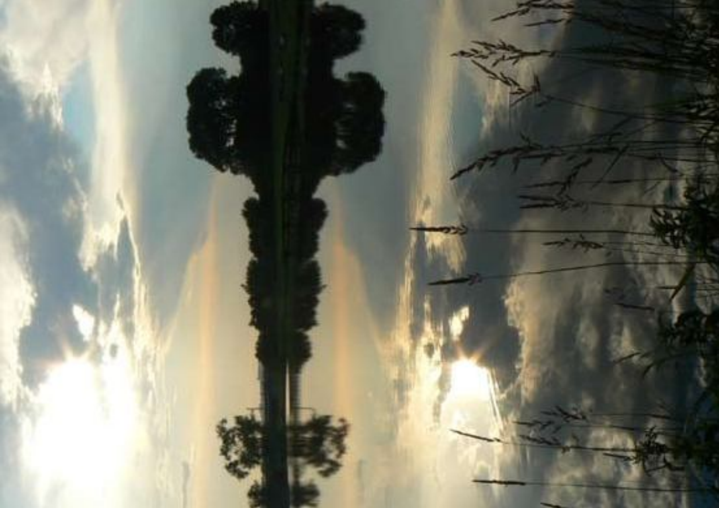
Pond in Koziegłowy