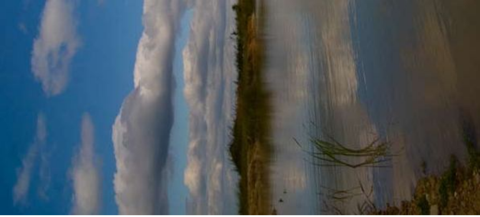
dirt road nearby Zabijak