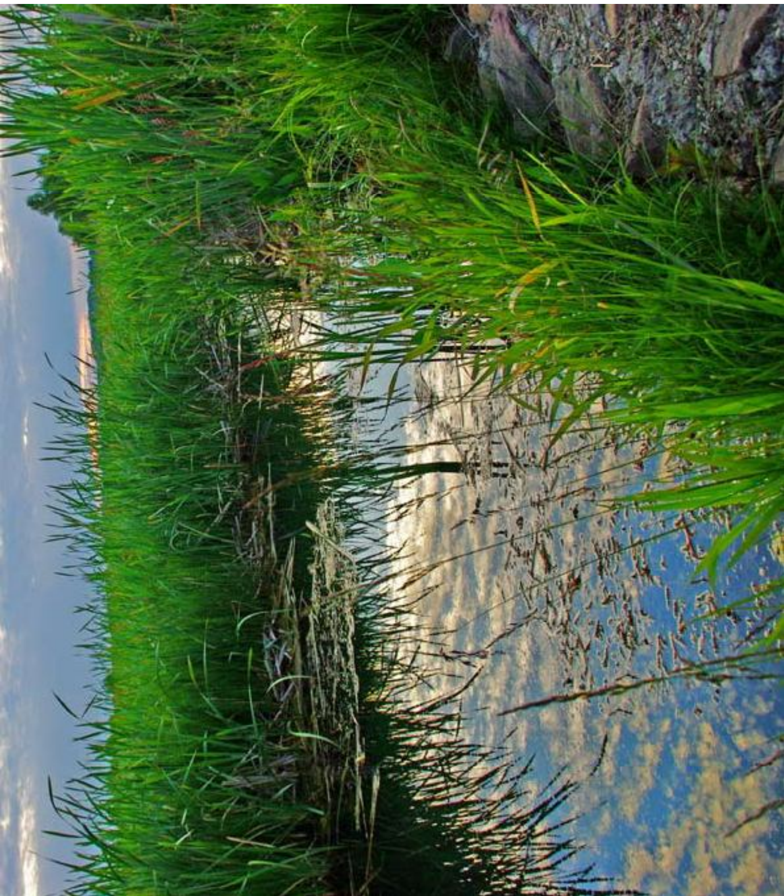
Rzeka Sarni Stok Sarni Stok river