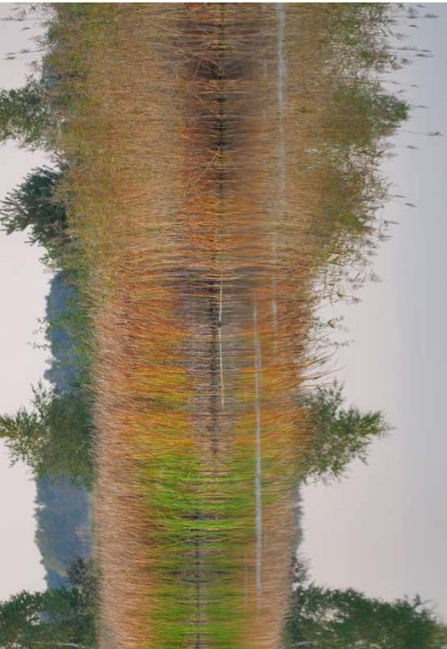
Zbiornik wodny w Gniazdowie Pond in Gniazdów