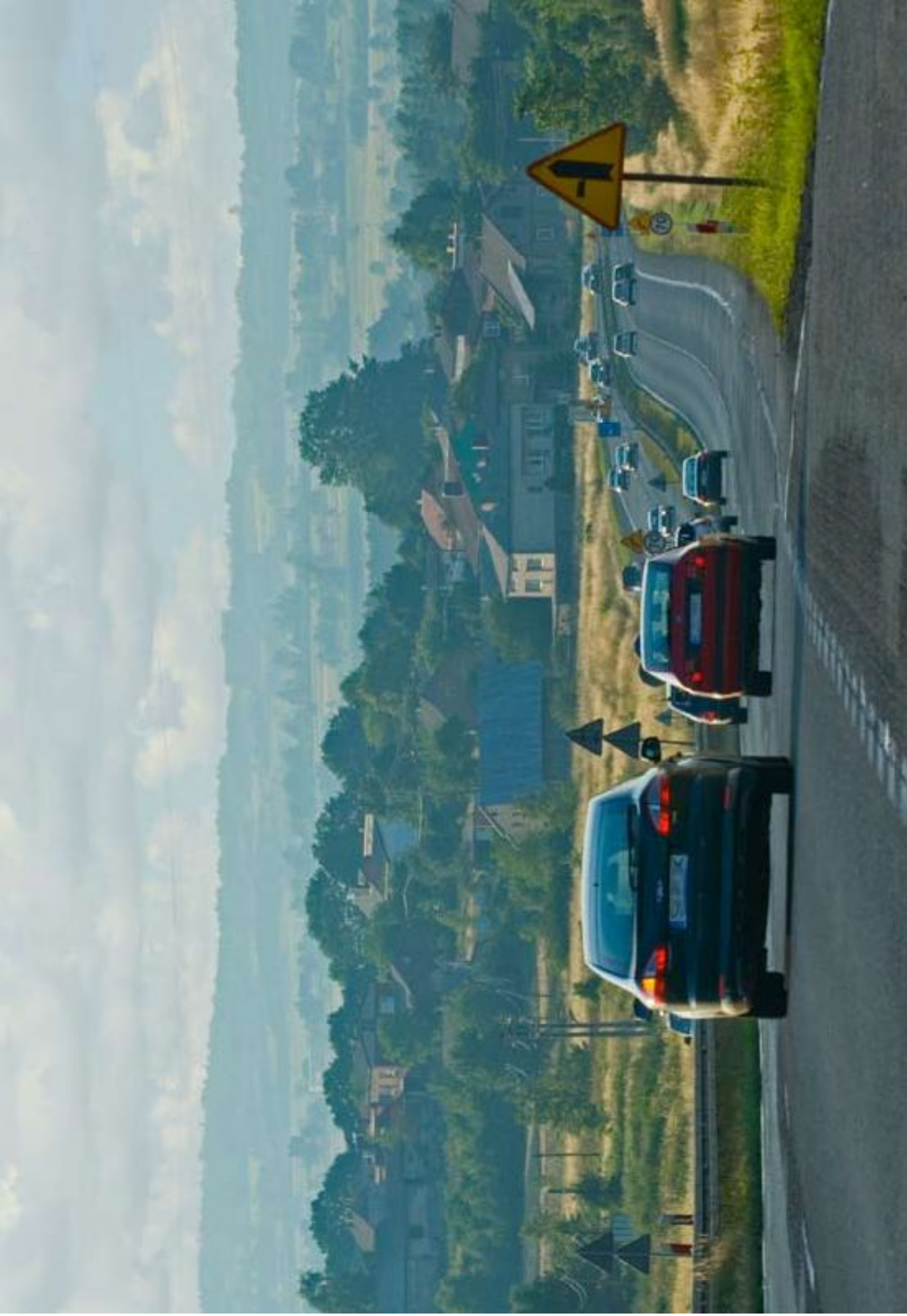
Trasa DK-1 w okolicach Winowna DK-1 Route nearby Winowno