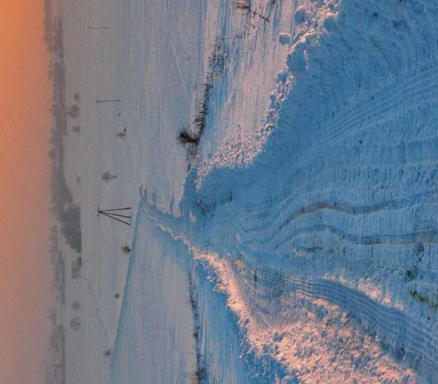
Polna droga w okolicach Zabijaka