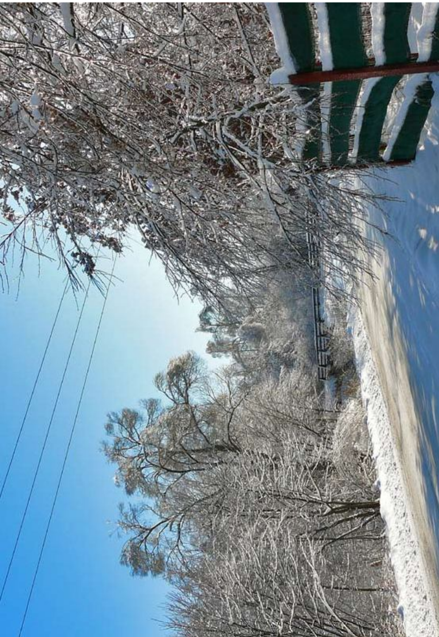
Zimowy pejzaż - Kuźnica Nowa