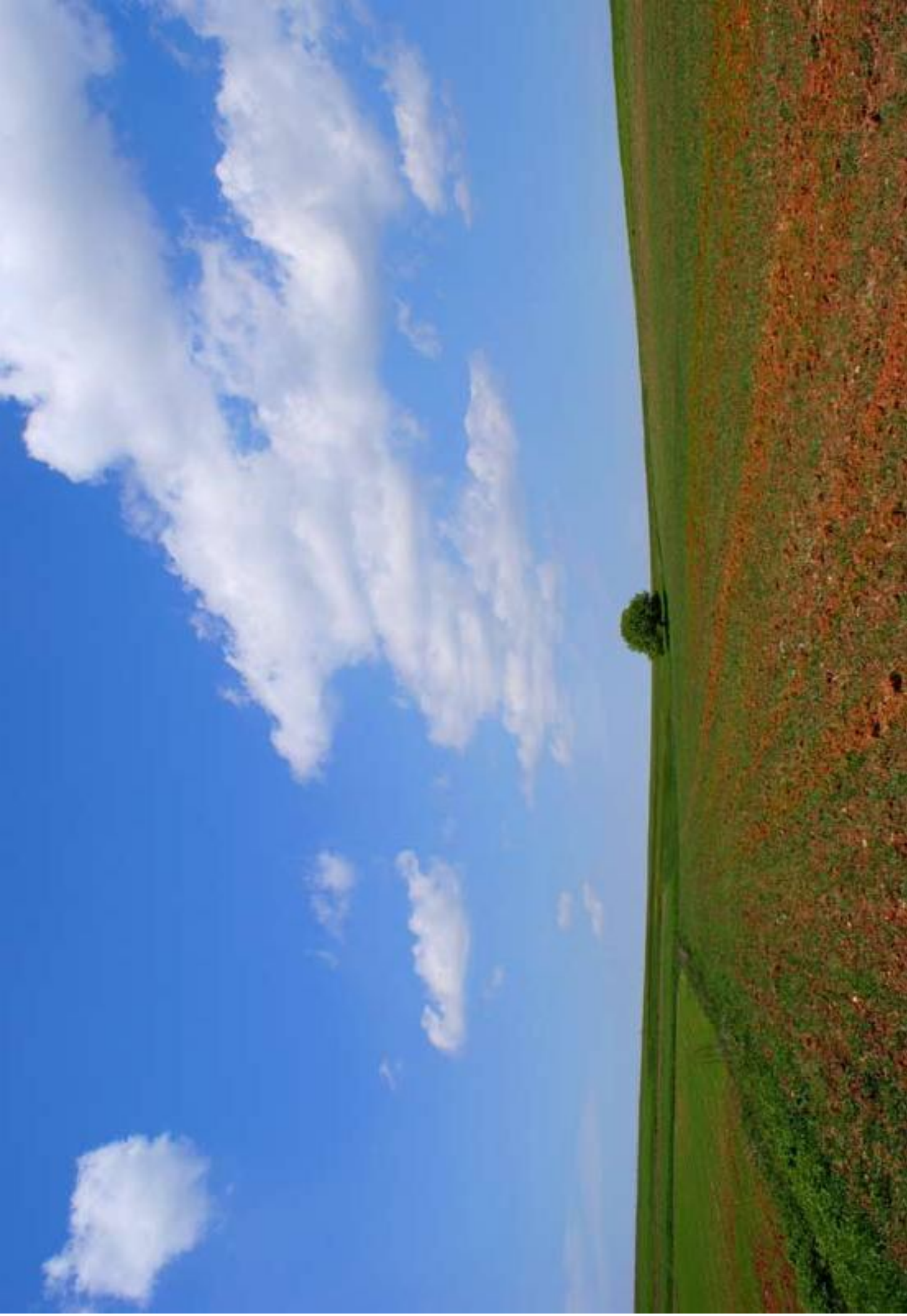
Samotne drzewo na polach w Markowicach Single tree in a field - Markowice