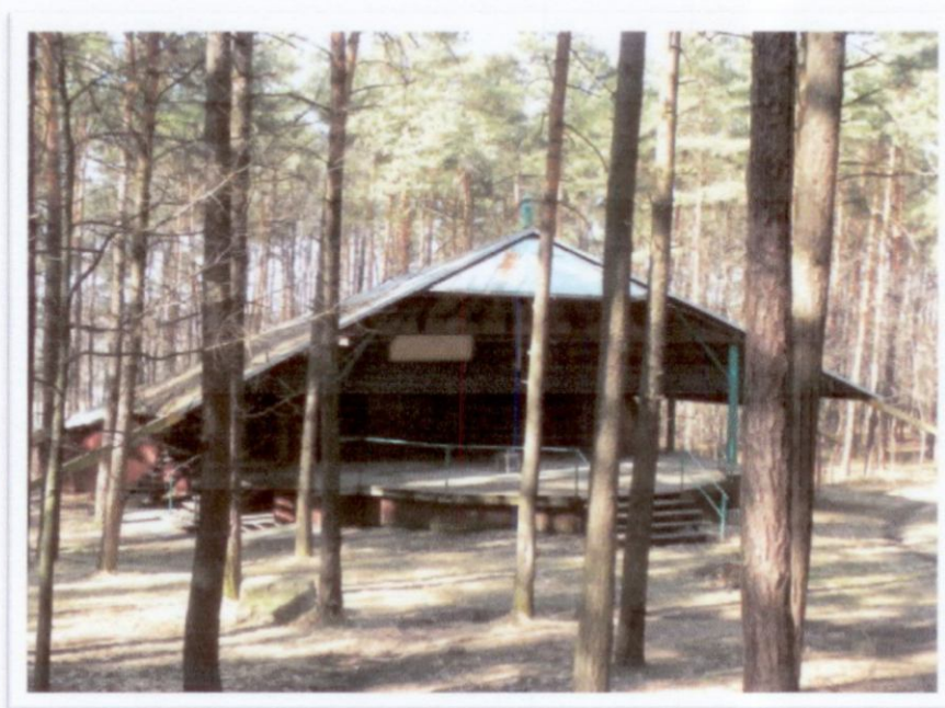
Rys.3 Obecny wygląd Amfiteatru w Rzeniszowie