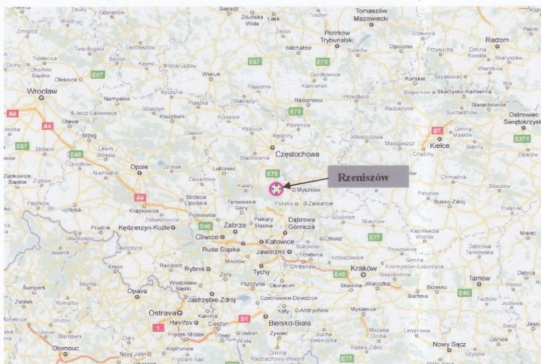
Rys. 2 Położenie miejscowości Rzeniszów

Miejscowość znajduje się w regionie częstochowskim w północnej części województwa śląskiego w powiecie myszkowskim.