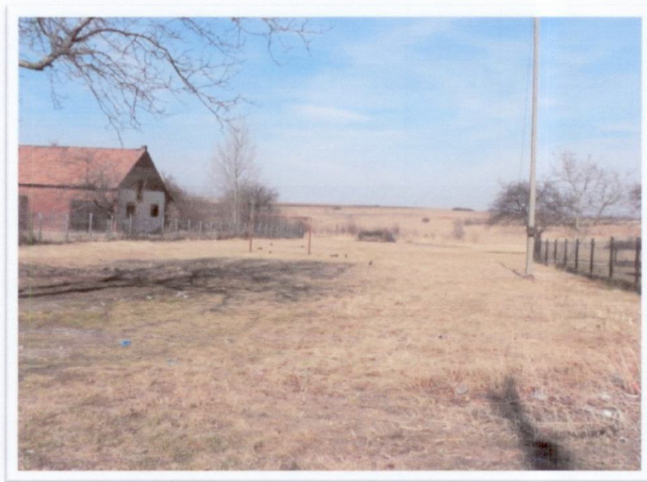
Rys.5 Teren przeznaczony pod budowę placu zabaw i boisko wielofunkcyjne

przyjazne i zrozumiałe dla dzieci i młodzieży a interesujące dla dorosłych. Wykreowanie przestrzeni publicznych spełniających oczekiwania mieszkańców, współtworzy obraz miejscowości, podnosząc jednocześnie jakość ich życia. Tereny te zbudują istotę życia wsi, będą miejscem dla interakcji i integracji.