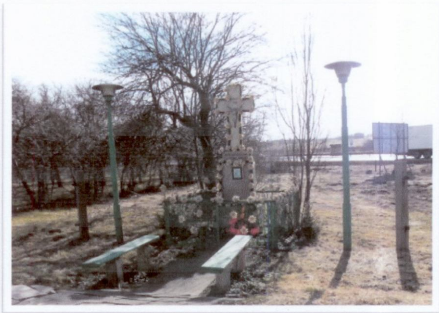
Rys. 4 Przydrożny Krzyż