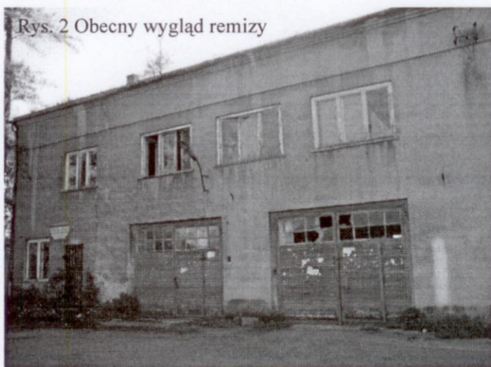
Rys. 2 Obecny wygląd remizy

Gdy ludzie zaczęli tracić pracę, upadło życie społeczne i kulturalne. Budynek remizy, nieużywany zniszczył się. Dopiero od paru lat mieszkańcy zaczęli powracać do udziału w inicjatywach społecznych. Wielu mieszkańców obecnie znalazło w nowych powstałych zakładach: Wytwórnia napojów gazowanych Postęp, Odlewnia Metali Nieżelaznych, zakłady produkcji butów